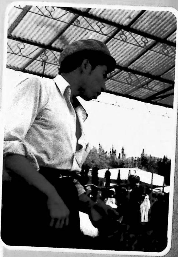
محلات الحزارة في سوق كاشغار... لا تختلف كثيرا عن الماضي