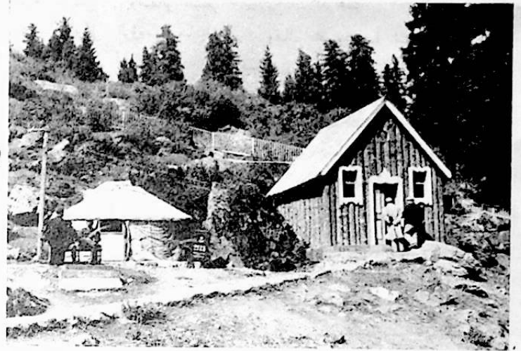
نموذج لمساكن المسلمين من قومية القازاق

المستمر، وطول موسم الزراعة نظرا للتفاوت في درجات الحرارة.. كل ذلك يساعد على انتاج الشمندر والفواكه - بطيخ، عنب، خوخ - وبعض القطن طويل التيلة الممتاز.