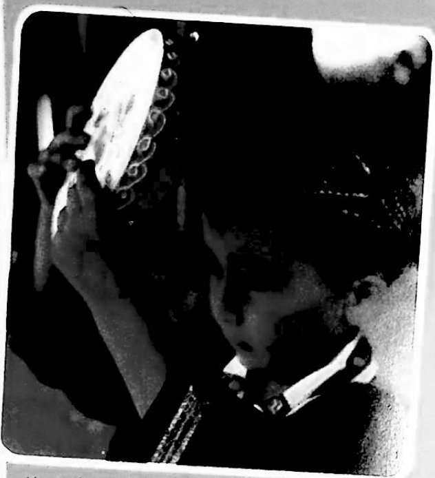
مغنية من أبناء قومية الويغور في توربان