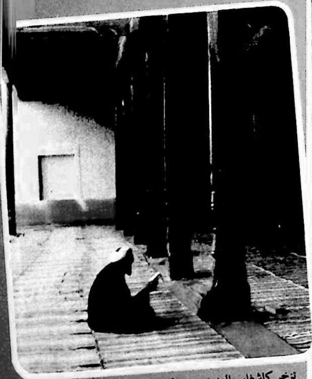
تزخر كاشغار بالعديد من المساجد