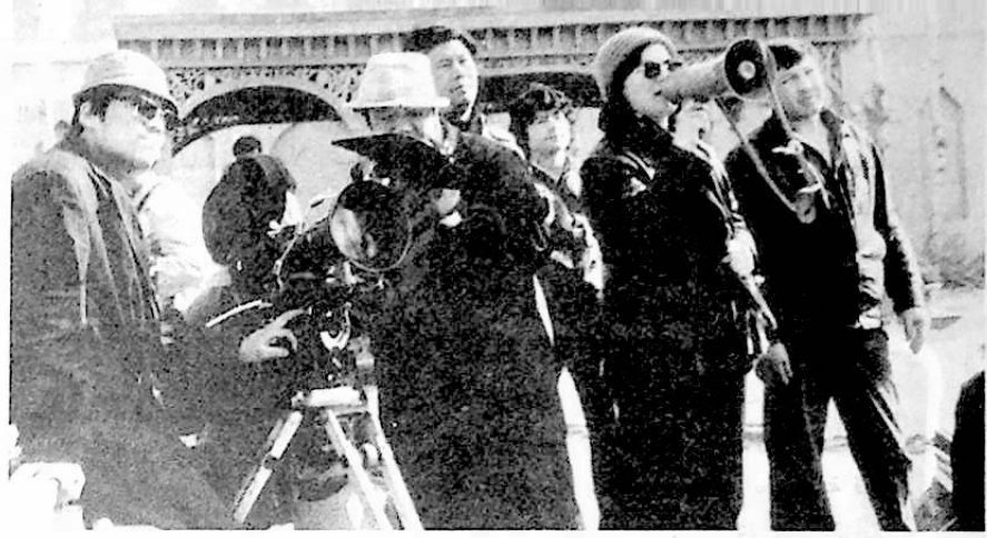
المخرجة قوانغ تشون لان مع العاملين السينائيين في تصوير فيلم « وفاة الحورية »