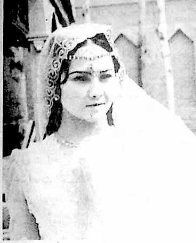
المثلة شاه غولي